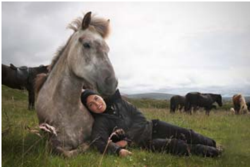
En hygge stund, med en dejlig hest

Den islandske hest – eller islænderen – som vi kalder den i daglig tale, er en speciel race af heste, der har udviklet sig isoleret i Island fra en nu udryddet race af skandinaviske arbejdsheste. Disse heste kom til Island med de første bosættere i det niende århundrede. I dag har hesten vundet popularitet overalt i verden for sin blide disposition og sit venlige gemyt.