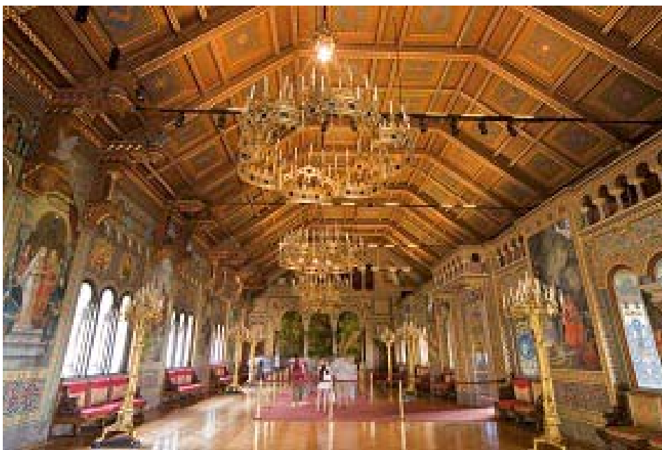
Indenfor på Neuschwanstein slot er salene rigt udstyret.

Det kan absolut anbefales at besøge det historiske slot. Det kræver en pæn kondition, hvis man vælger at gå fra parkeringspladsen nede i den lille